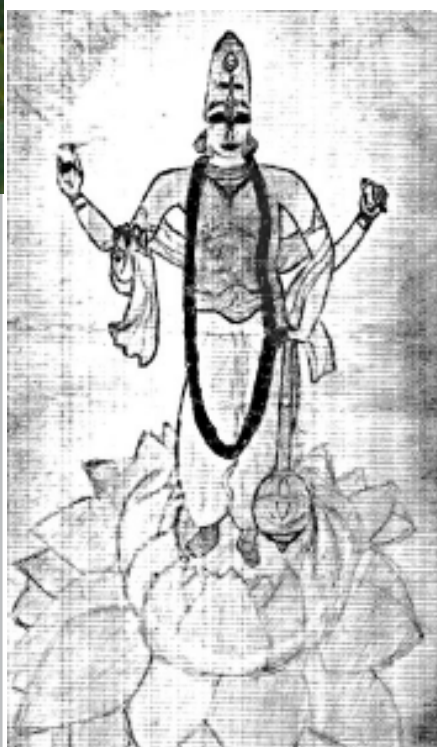
І място: “Нараяна Кришна”, бх. Баларама, гр. Плевен